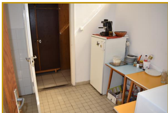
Jelenlegi konyha (tervezett akadálymentes mosdó)