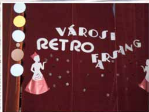
VÁROSI RETRO FARSANG